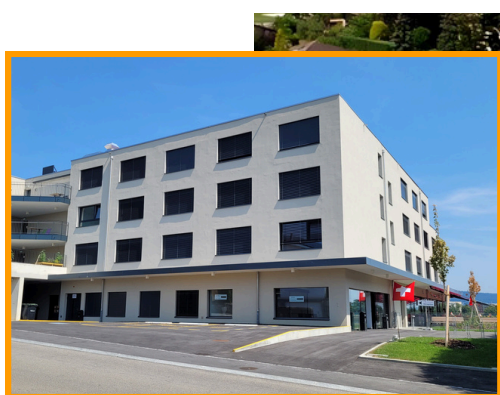
Façade côté Rte des Addoz

Chaque étage hébergeant nos résidents (1er, 2ème et 3ème) est composé des pièces communautaires suivantes : Une salle-à-manger, un salon, des terrasses.