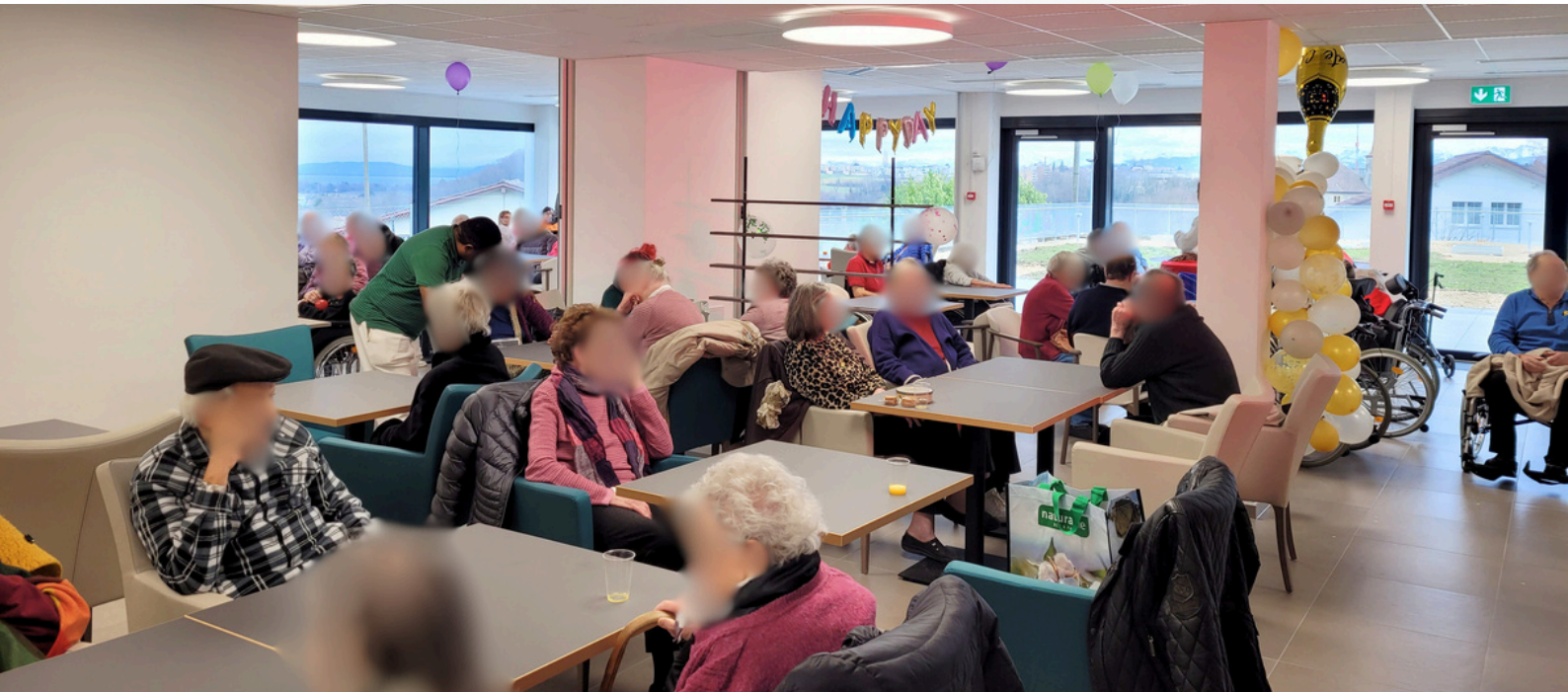
Photo de la Salle lors de l'emménagement du 24 janvier 2024

Comité directeur EMS CARPE DIEM SA Route des Addoz 4A 2017 Boudry Mail : direction@ems-carpediem.ch