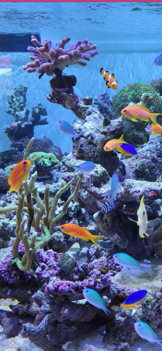
L'aquarium d'eau de mer

Caféteria « L'aquarium » avec terrasse panoramique : Ouverte à tous les visiteurs de 08h00 à 19h00. Boissons et snacks divers.