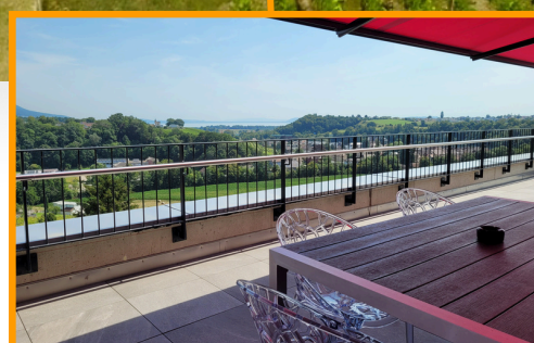
Terrasse 3ème étage

Au 1er étage, se trouve également un jardin thérapeutique ainsi qu'une salle snoezelen et au 2ème étage, une salle de bain thérapeutique (avec baignoire, douche et WC.)