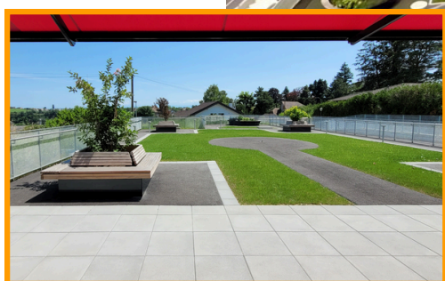
Terrasse et jardin rdc