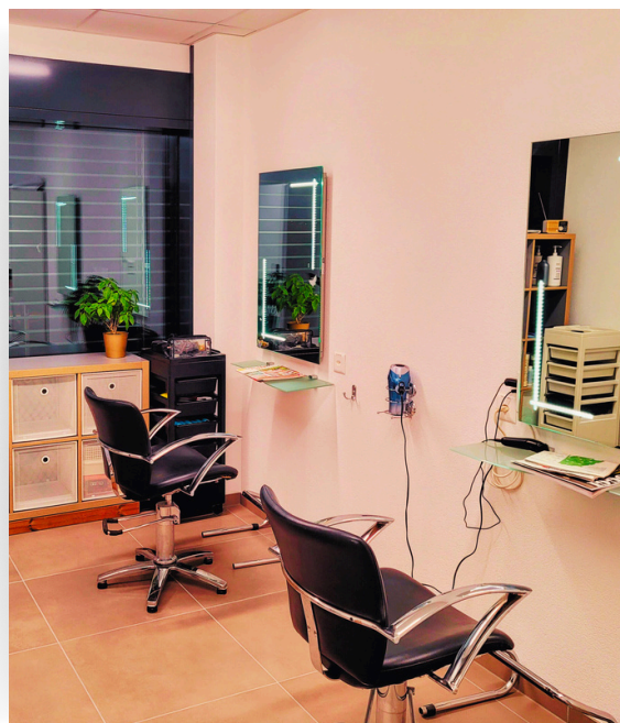
Salon de coiffure et pédicure

Des services de bien-être sont disponibles sur place pour les résidents. Pour consulter les tarifs et prendre RDV veuillez employer le système de communication à travers votre TV ou vous adresser au responsable de votre étage.