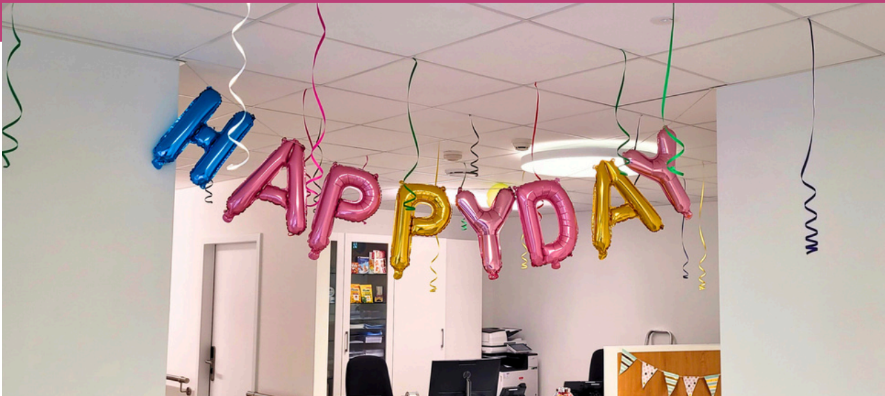
Entrée de l'EMS lors du déménagement le 24 janvier 2024

Lors de l'annonce d'une demande d'admission, une visite est organisée au lieu de vie ou d'accueil du futur résident : Hôpital, foyer, appartement, etc.