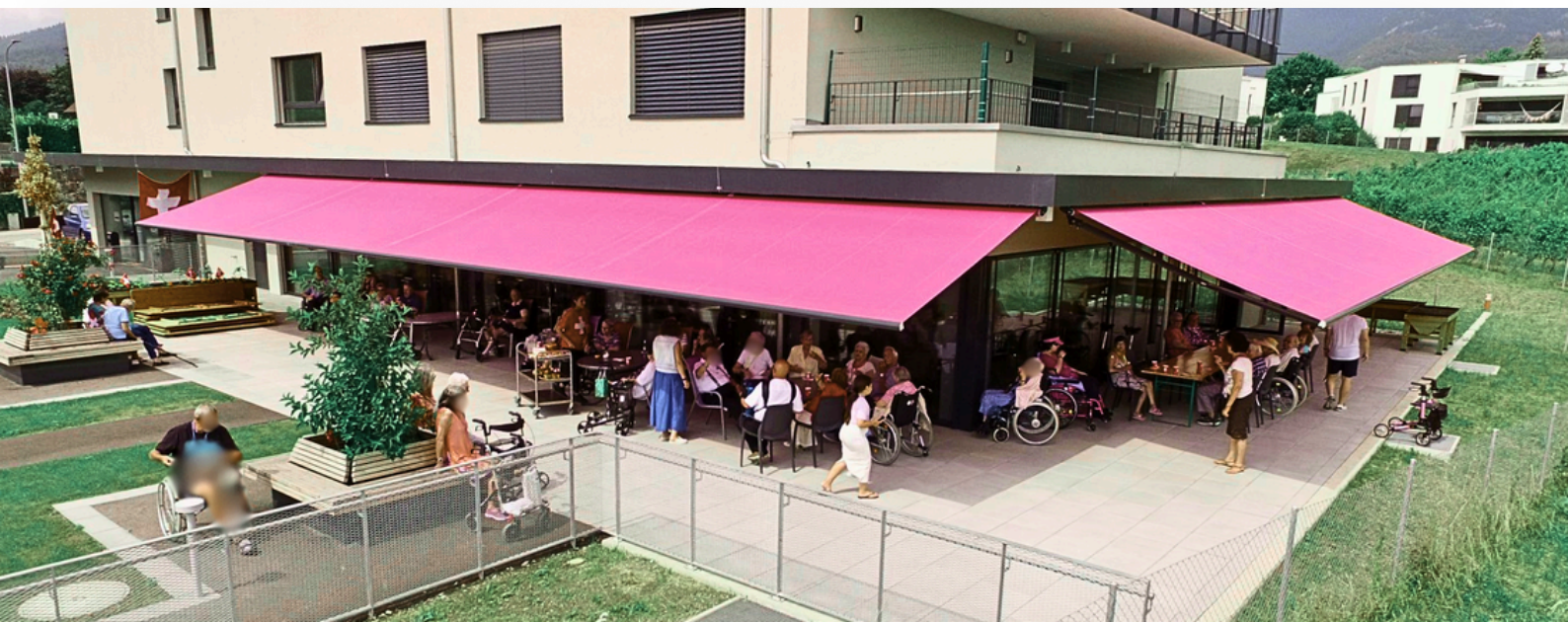
Vue aérienne de la Terrasse

Les salles polyvalentes : Des lieux de rencontre et de créativité où les résidents peuvent se réunir pour diverses activités autonomes ou avec un encadrement sympathique.